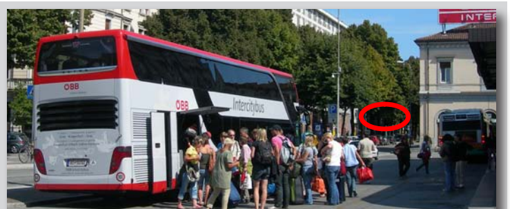
Der IC-Bus hält in Udine vor dem Bahnhofsgebäude (rechts). Dahinter liegt in kurzer Distanz der Busbahnhof (roter Kreis).

Der Gesamtpreis pro Richtung von ca. € 15 bis € 19 pro Person (mit ÖBB-VC-Classic) bzw. ca. € 51 bis € 56 für eine ganze Familie kann sich durchaus sehen lassen.