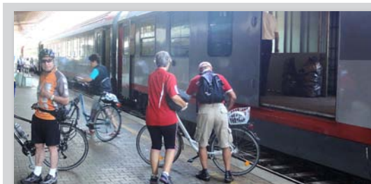
Der „Micotra“-Zug ist auch für den Radtransport unkompliziert nutzbar.