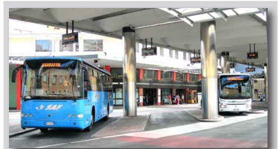
Klimatisierte Busse fahren vom Busbahnhof in Udine u.a. nach Lignano und Grado.

WC ausgestatteten) Busbahnhofes den ersten italienischen Espresso. Dort sollte man auch das Busticket nach Lignano kaufen, da in Italien bei den Busfahrern in der Regel keine Tickets erhältlich sind.