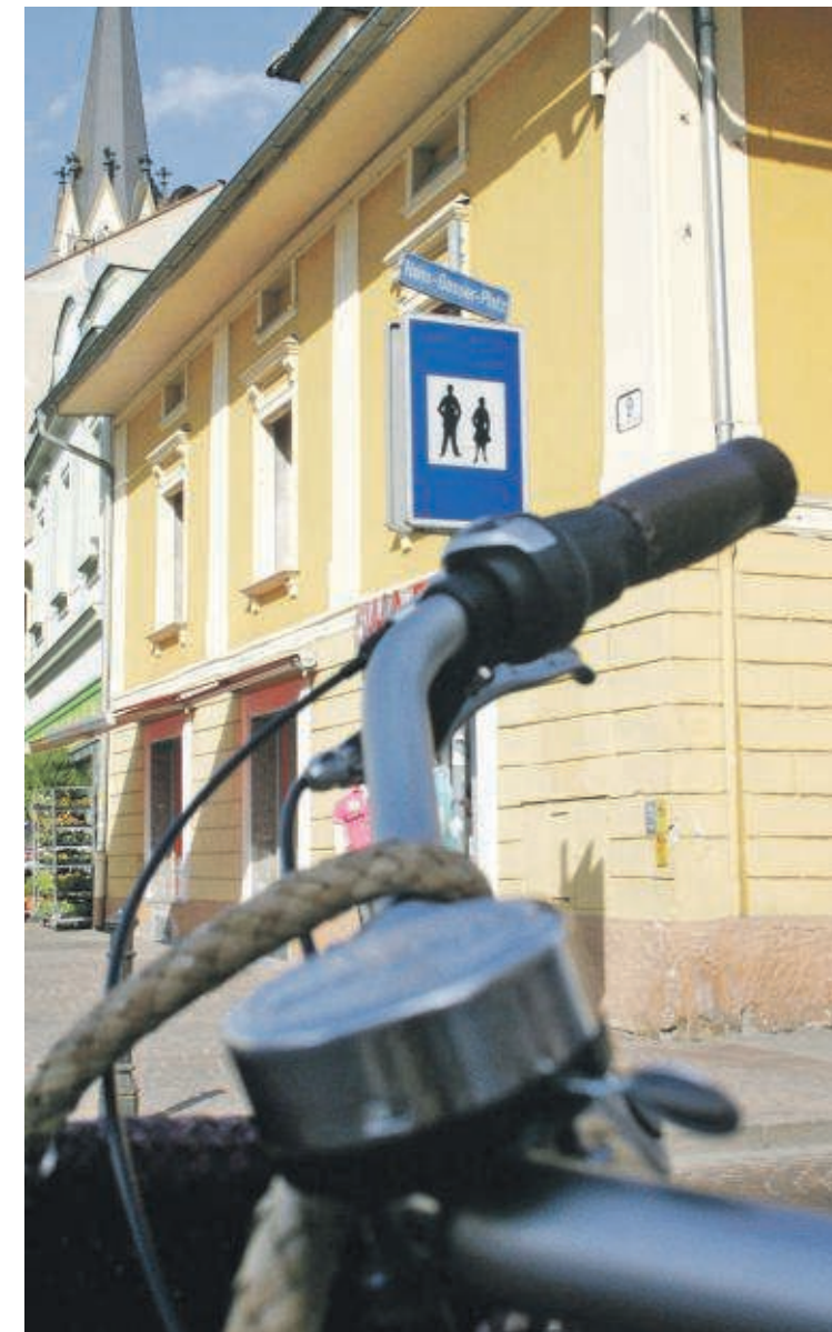
Radeln in der Fußgängerzone? Möglichkeiten werden geprüft

Was ist in Zukunft möglich? „Ich möchte nicht vorgreifen, aber es gibt Studien, die in Begutachtung sind, wo man Radfahren gegen die Einbahn erlauben kann. Das muss abgeklärt werden, man wird meine Handschrift erkennen“, sagt Albel, der den Bahnhof als Standort für die versperrbaren Radboxen forciert. „Wir unterstützen das. Vor allem ist es eine sinnvolle Einrichtung, wenn